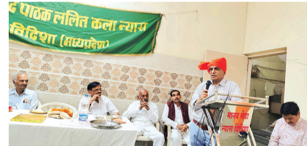
विदिशा। मानव सेवा न्यास में किया गया काव्य-संध्या का आयोजन।