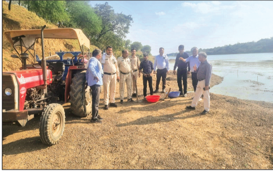
विदिशा। राज्य स्तरीय टीम द्वारा रेत खदानों पर जाकर जांच की तो ज्यादातर स्थानों पर रेत का अवैध उत्खनन करते हुए वाहन जब्त किए गए।

■ रेत खदानों पर प्रतिबंध होने के बाद भी हो रहा है खनन।