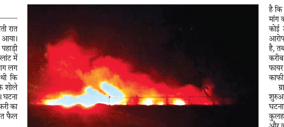
पर इस हादसे में लाखों रुपये के नुकसान की आशंका जताई जा रही है। राहत की बात यह रही कि इस घटना में कोई जनहानि नहीं हुई। फिलहाल आग लगने के कारणों का पता नहीं चल सका है। आशंका जताई जा रही है कि आग अज्ञात कारणों से लगी। जिसकी पुष्टि जांच के बाद ही हो सकेगी। घटना के बाद स्थानीय प्रशासन और संबंधित विभागों की ओर से नुकसान का आकलन और जांच की प्रक्रिया शुरू किए जाने की बात कही जा रही है। इस घटना के बाद एक बार फिर दीवानगंज क्षेत्र में फायर ब्रिगेड की स्थायी व्यवस्था नहीं होने का मुद्दा गरमा गया है। ग्रामीणों का कहना

रायसेन जिले के दीवानगंज क्षेत्र में बीती रात एक बड़ा आगजनी हादसा सामने आया। दीवानगंज के पास खेजड़ा जमुनिया पहाड़ी पर स्थित वेलस्पन कंपनी के कोटिंग प्लांट में रात करीब 10 बजे अचानक भीषण आग लग गई। आग की लपटें इतनी भयावह थी कि उसकी ऊंची-ऊंची लपटें और आग के शोले कई किलोमीटर दूर से दिखाई दे रही थीं। घटना के बाद आसपास के गांवों में अफरा-तफरी का माहौल बन गया और ग्रामीणों में दहशत फैल गई। सूचना मिलते ही बालमपुर एयरफोर्स की दो फायर ब्रिगेड तथा भोपाल से चार दमकल वाहन मौके पर पहुंचे। फैंक्ट्री में मौजूद अग्निशमन संयंत्रों की मदद से करीब दो घंटे की कड़ी मशकत के बाद आग पर काबू पाया जा सका। तब तक आग की चपेट में आकर प्लांट में रखा उपकरण, मशीनरी और रॉ मैटैरियल जलकर राख हो गया। प्रारंभिक तौर