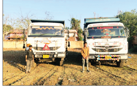
विदिशा। राज्य स्तरीय टीम द्वारा रेत खदानों पर जाकर जांच की तो ज्यादातर स्थानों पर रेत का अवैध उत्खनन करते हुए वाहन जब्त किए गए।

कार्रवाई की। इस दौरान जिले की सभी 16 रेत खदानों का मौके पर निरीक्षण किया गया, जिससे खनन गतिविधियों को वास्तविक स्थिति का आकलन किया जा सके। निरीक्षण के दौरान टीम ने अवैध गतिविधियों पर प्रभावी कार्रवाई करते हुए खनिजों का अवैध परिवहन कर रहे 11 वाहन (डम्पर एवं ट्रैक्टर-ट्रॉली) तथा अवैध उत्खनन करते 01 वाहन (ट्रैक्टर-ट्रॉली) को जब्त किया।