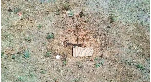
पौधरोपण अभियान में कलेक्टर पंकज पांडे सहित शिक्षा विभाग वन अरुण विश्वकर्मा, तत्कालीन एस्पी विभाग के क्षेत्रीय अधिकारी

सिलवानी तहसील के चैनपुर में वन विभाग द्वारा विस्तार वानिकी योजना और 'एक बगिया मां के नाम' अभियान के तहत चैनपुर स्कूल परिसर में करीब छह महीने पहले बड़े स्तर पर पौधरोपण कराया गया था, लेकिन अब हालत यह है कि वहां हरियाली की जगह सिर्फ सूखे पौधों के डंडल नजर आ रहे हैं। पौधों की देखरेख नहीं होने से पूरी बगिया लगभग उजाड़ चुकी है। इस